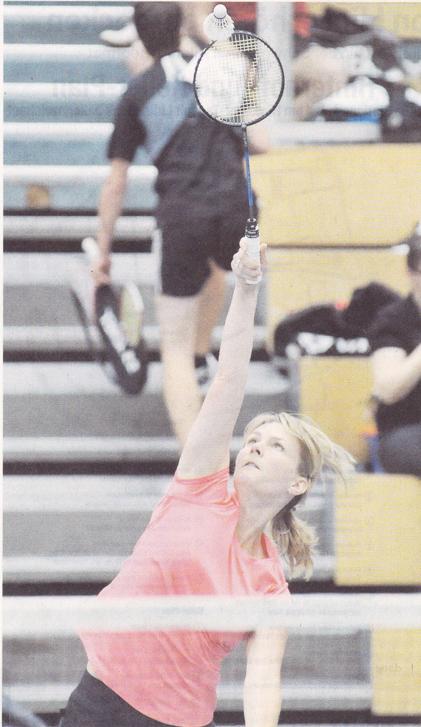
Attraktiver Badminton-Sport wurde an den beiden Tagen in der Hans-Hocheder-Sporthalle geboten.