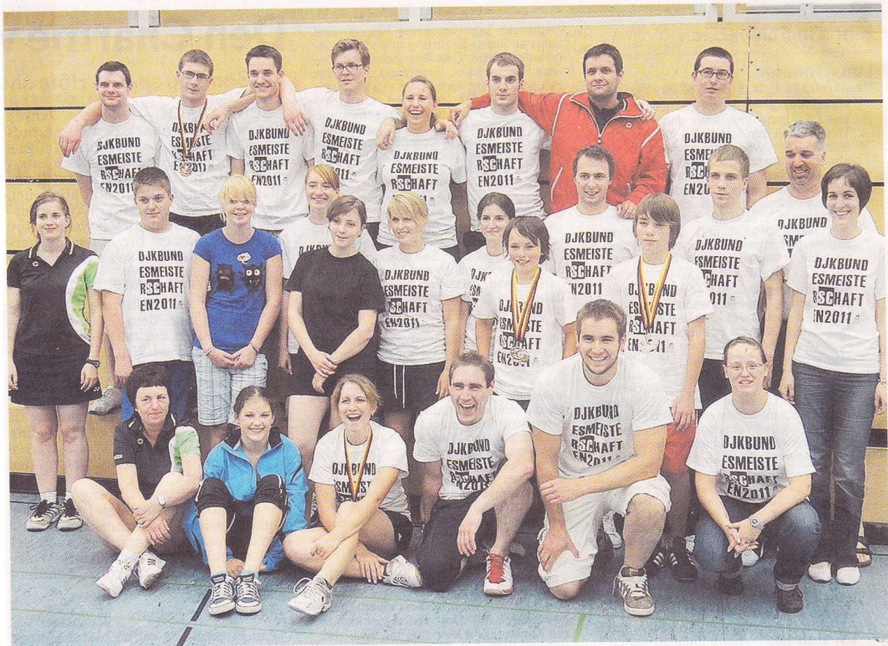
Die Medaillengewinner der DJK Schwabach auf einen Blick.